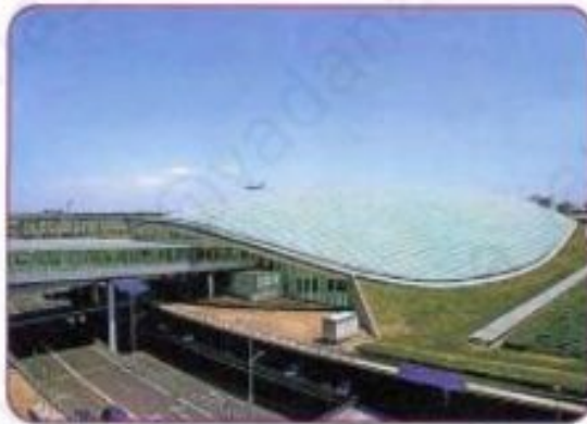
The Beijing International Airport is the largest in the world.