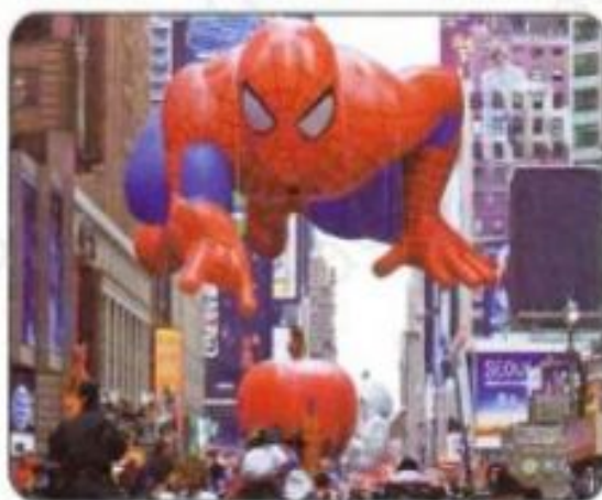
Thanksgiving Parade, the United States