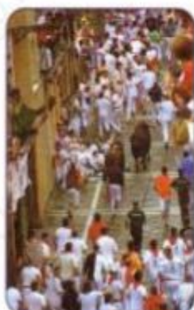
Los Sanfermines, Spain