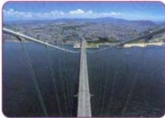
Japan's Akashi-Kaikyo Bridge is the longest suspension bridge in the world.