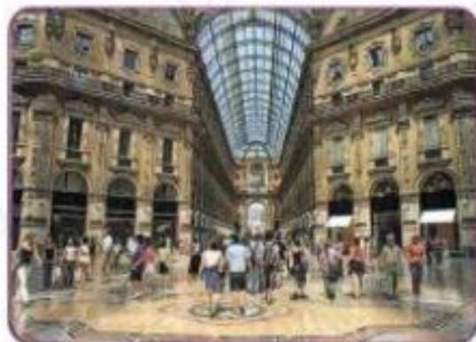
The Galleria Vittorio Emanuele II in Milan, Italy, is probably the oldest shopping mall in the world.