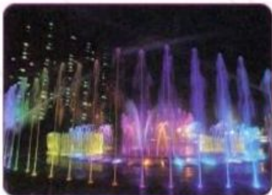
South Korea's Dadaepo Sunset Fountain of Dreams is the world's largest fountain.