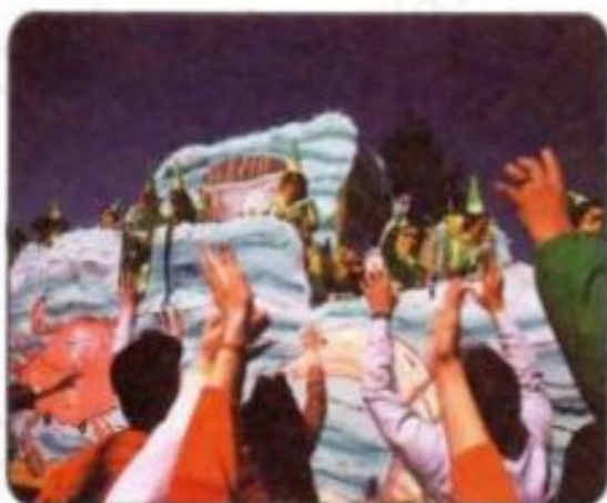
Mardi Gras, Brazil