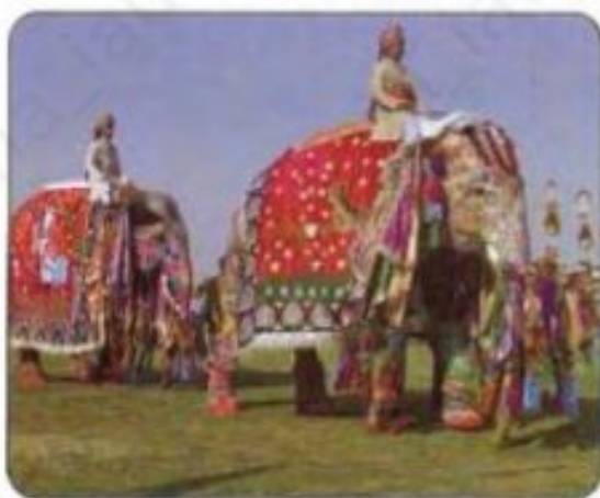
Jaipur Elephant Festival, India